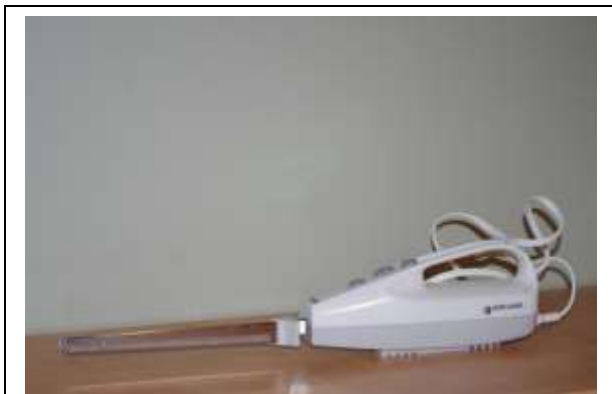
La technologie comble le besoin de confort de l'être humain ou attise ses excès.

La technologie accentue ou contribue à certaines propensions humaines qui sont dommageables pour la nature. Comme on l'a vu ailleurs , une de celles-ci réside dans notre besoin constant de renouveau, qui est alimenté en partie par l'innovation technique et technologique. Une autre tendance humaine consiste à rechercher continuellement un plus grand confort matériel. Les hominidés ont en effet toujours cherché à se protéger des aléas de la nature et à améliorer leur condition. Cette tendance est profondément ancrée en l'être humain puisqu'il s'est longtemps agi, comme pour toutes les espèces vivantes, d'une question de survie. Dans notre cas, la faculté de concevoir et fabriquer des outils fait partie de notre succès évolutif. De la maîtrise du feu, aux armes et aux techniques de chasse, en passant par la poterie, la médecine ou l'agriculture et l'élevage, nous avons inventé des instruments et des méthodes, ou découvert et compris des phénomènes, qui ont eu de profonds impacts sur notre survivance et sur notre qualité de vie.